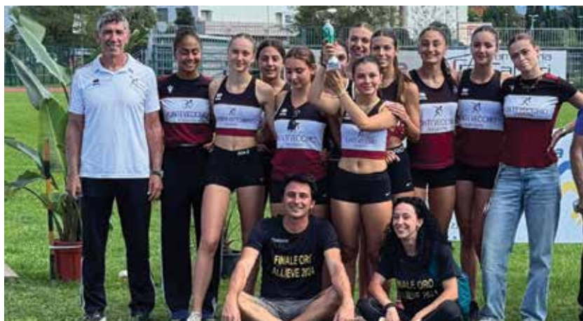
La squadra Allievi di Pontevecchio Bologna, quinta in Italia, con lo staff tecnico

730+ Modello Redditi (ex Unico) Prenota un appuntamento al 051 549610