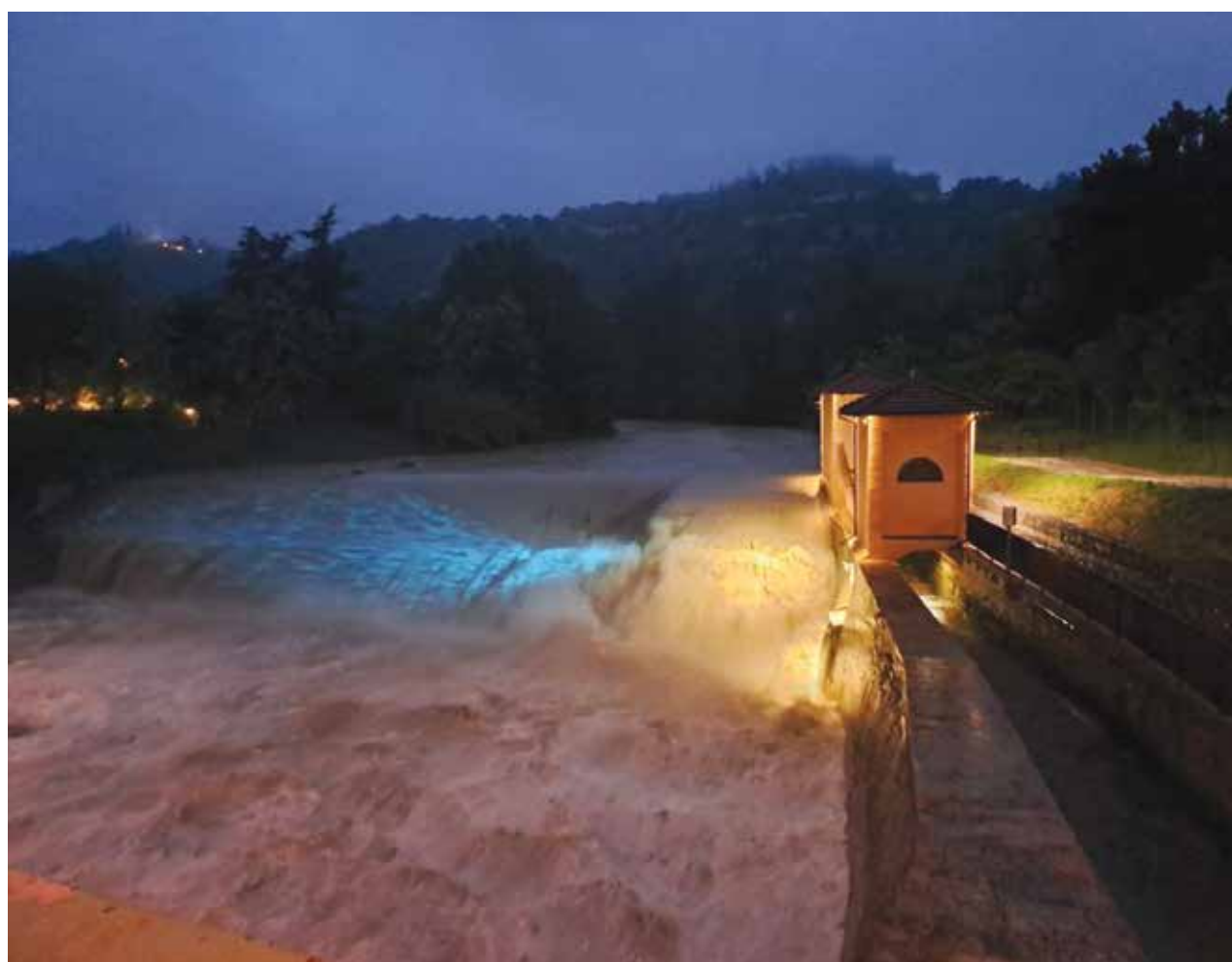
La Chiusa, il Savena e il suo canale

...ma con quegli stessi canali ancora vivi, coperti o scoperti che siano, ad assolvere quelle funzioni fondamentali da cui prendono sostentamento la qualità am-