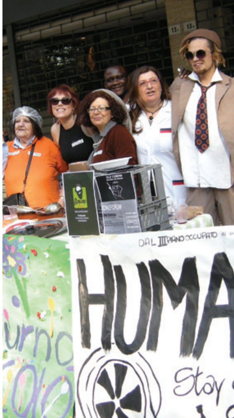
Il Centro diurno al Festival della Zuppa

I volontari che si mettono a disposizione arricchiscono le nostre attività, aggiungono competenze e creano per tutti nuovi stimoli,