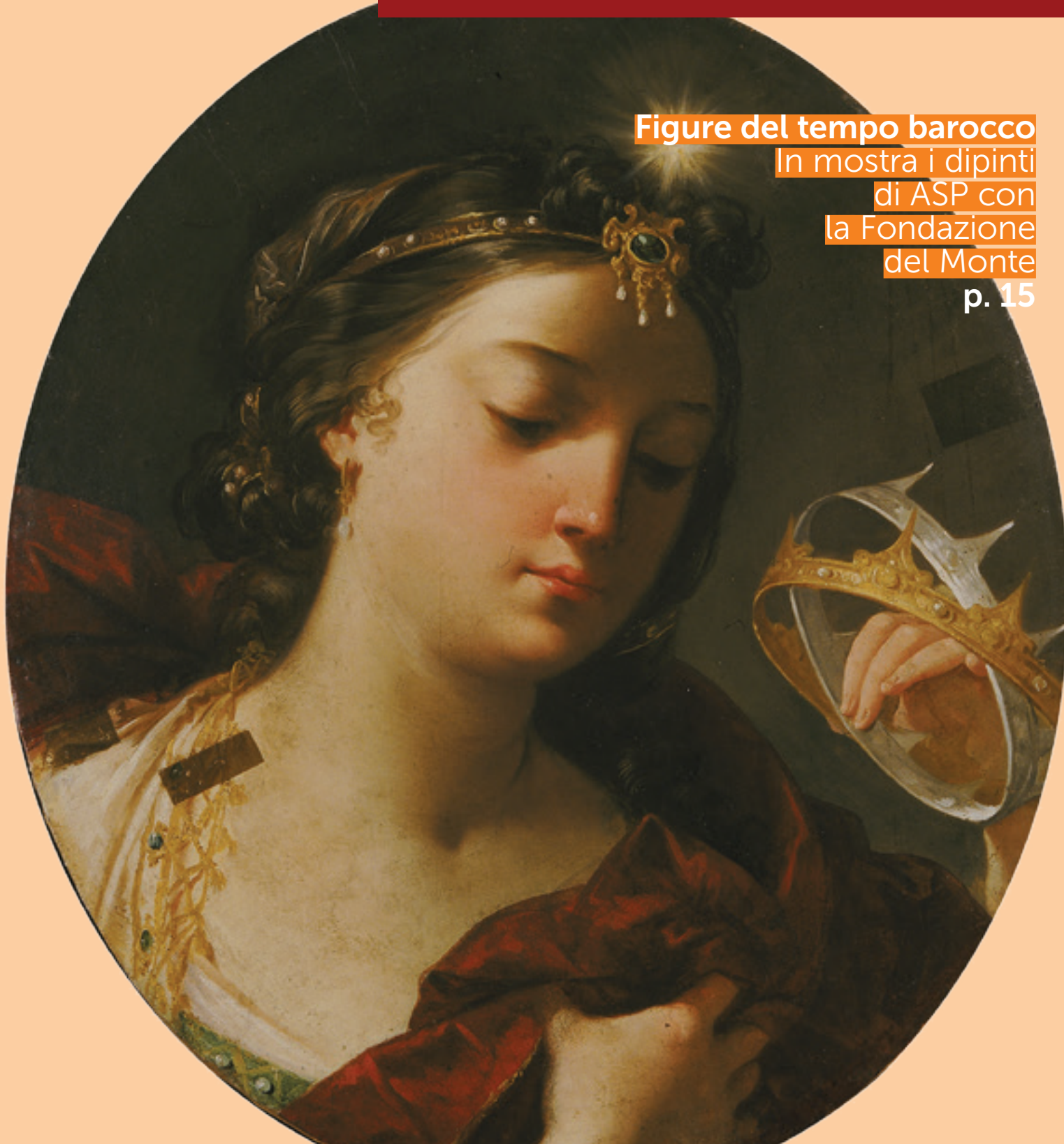
Figure del tempo barocco

In mostra i dipinti di ASP con la Fondazione del Monte